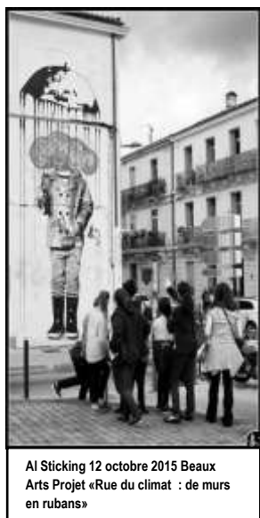
AI Sticking 12 octobre 2015 Beaux Arts Projet «Rue du climat : de murs en rubans»

Les perspectives ouvertes après l'accord de Paris sur le climat de la COP21 vont dynamiser les politiques d'adaptation aux changements climatiques sur les territoires quatre ans après le lancement du premier accord. Cependant comme le souligne le rapport du Conseil Général de l'Environnement et du Développement Durable (CGEDD), le prochain plan d'actions dont la date d'entrée en vigueur est fixée au 1 er Janvier 2017 doit être décliné à des échelles territoriales : entre les régions, les Etablissements Publics de Coopération Intercommunale (EPCI) et ce avec l'appui de l'Etat. Ces actions couvrent un large secteur d'adaptations.