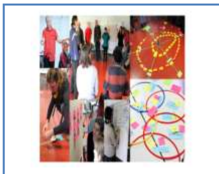
Atelier Participatif GRD PARCS

(2) L' Atelier participatif citoyen propose de construire des outils participatifs d'aide à la décision vis-à-vis des actions publiques à mener. Ce dispositif se décline en deux temps :